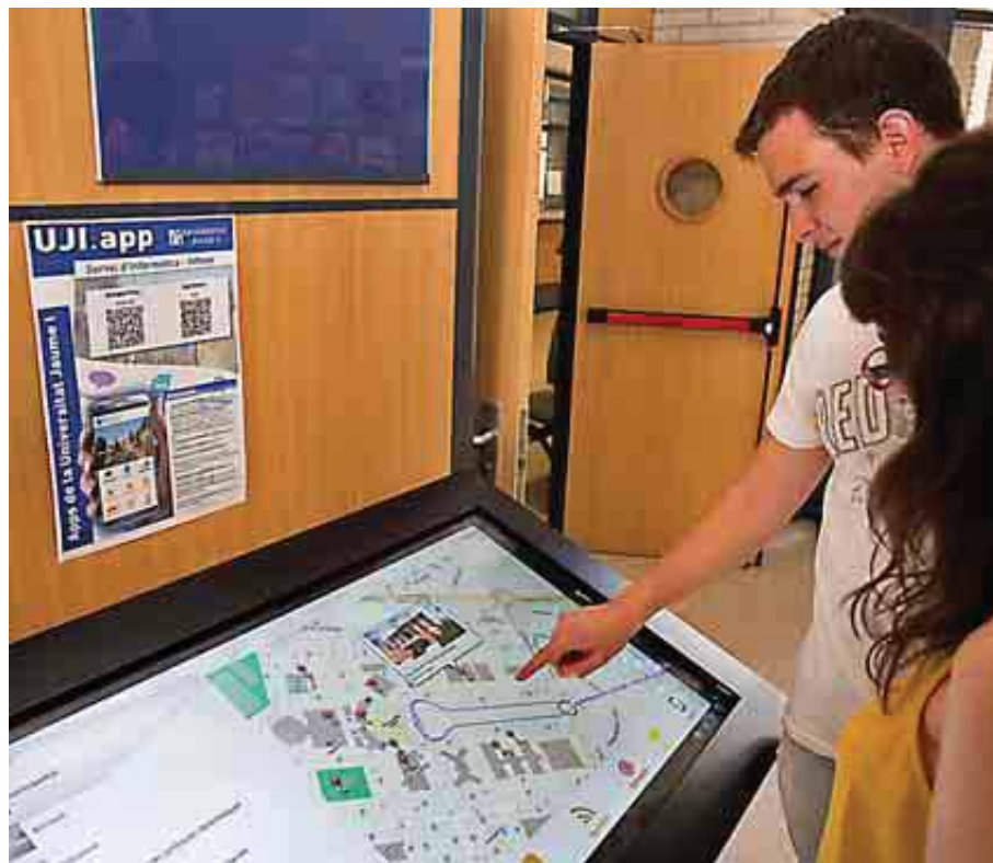
UNIVERSIDAD JAUME I