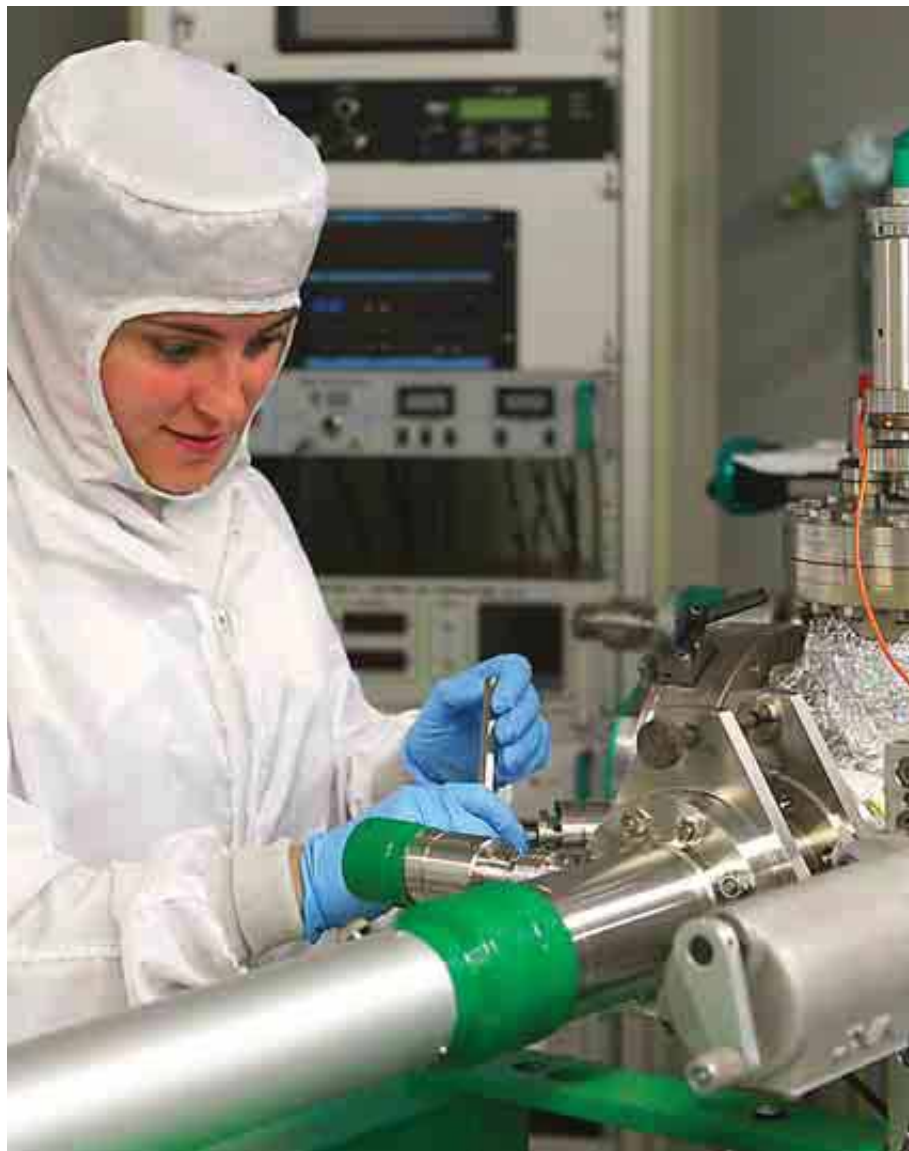
UNIVERSIDAD POLITÉCNICA DE MADRID

Cuenta con el reconocimiento de Campus de Excelencia Internacional Agroalimentario. Oferta un centenar de plazas de nuevo ingreso.