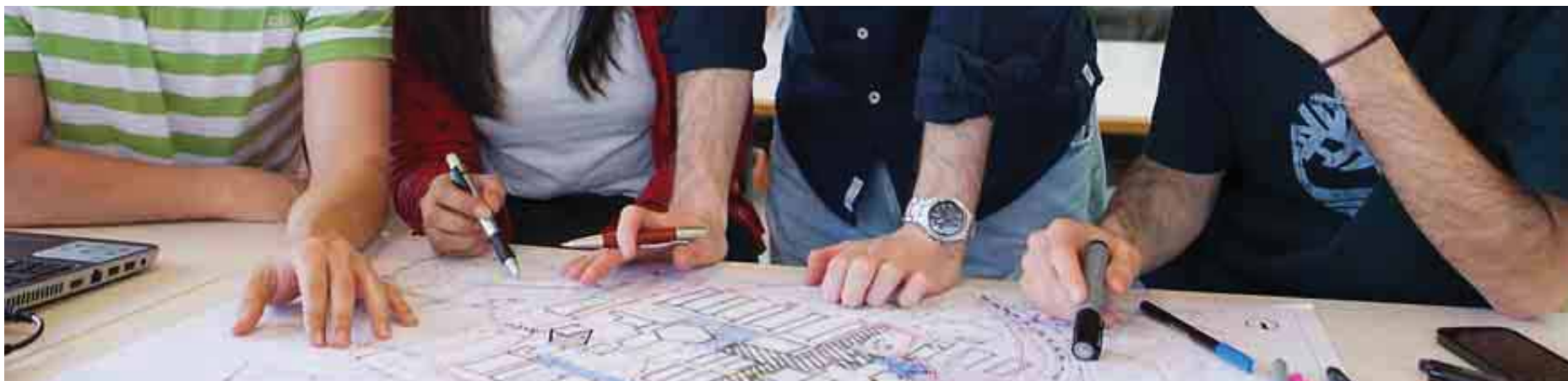
UNIVERSIDAD DE BARCELONA

Todo, o casi, en favor de Ciencias de la Salud, que se espera que alcance el 16,5% del total y que es el ámbito de mayor crecimiento de los últimos años. De hecho, en dos décadas (del curso 92/93 al 12/13) ha visto cómo han aumentado los alumnos en un 112%. Ciencias sigue su caída de estudiantes, casi un punto porcentual respecto al curso pasado y es la única rama, junto con Artes y Humanidades, que ha perdido estudiantes en el histórico de los últimos 20 años. La división simple siempre se ha realizado entre letras o ciencias; sin embargo, la elección de los futuros estudiantes tendrá que ir más allá.