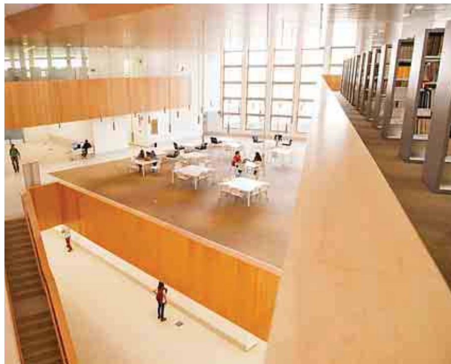
UNIVERSIDAD CARLOS III