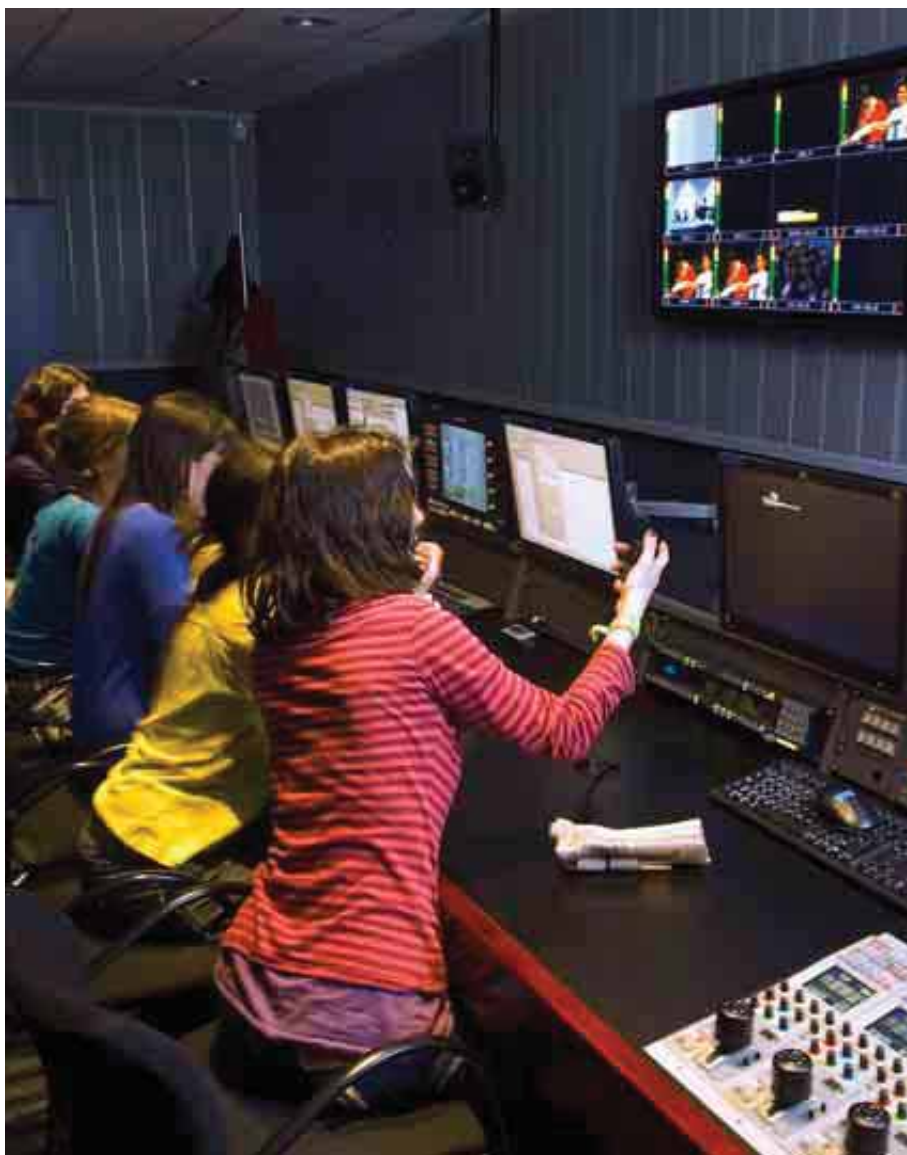
UNIVERSIDAD POMPEU FABRA

Su ubicación en una ciudad con gran tradición de empresas del sector facilita el acceso de los alumnos para realizar prácticas profesionales.