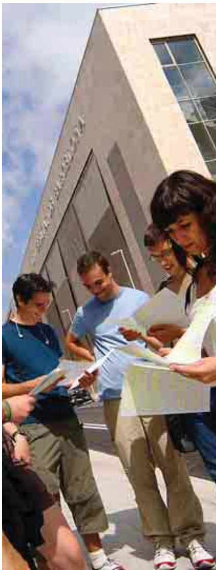
UNIVERSIDAD AUTÓNOMA DE BARCELONA

Para realizar el prácticum cuenta con unas 60 empresas colaboradoras externas, cinco hospitales y tres centros de salud públicos.