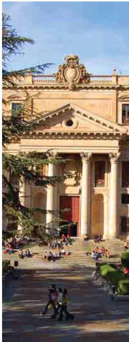
UNIVERSIDAD DE SALAMANCA

Destaca por sus convenios de movilidad internacional y con empresas e instituciones para la realización de las prácticas externas.