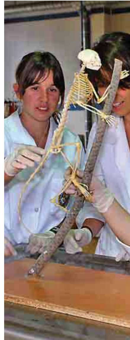
UNIVERSIDAD ALFONSO X EL SABIO

Preside la Red Interuniversitaria de Posgrados en Turismo y colabora con Tourespaña, Segittur y el Consejo Superior de Cámaras.