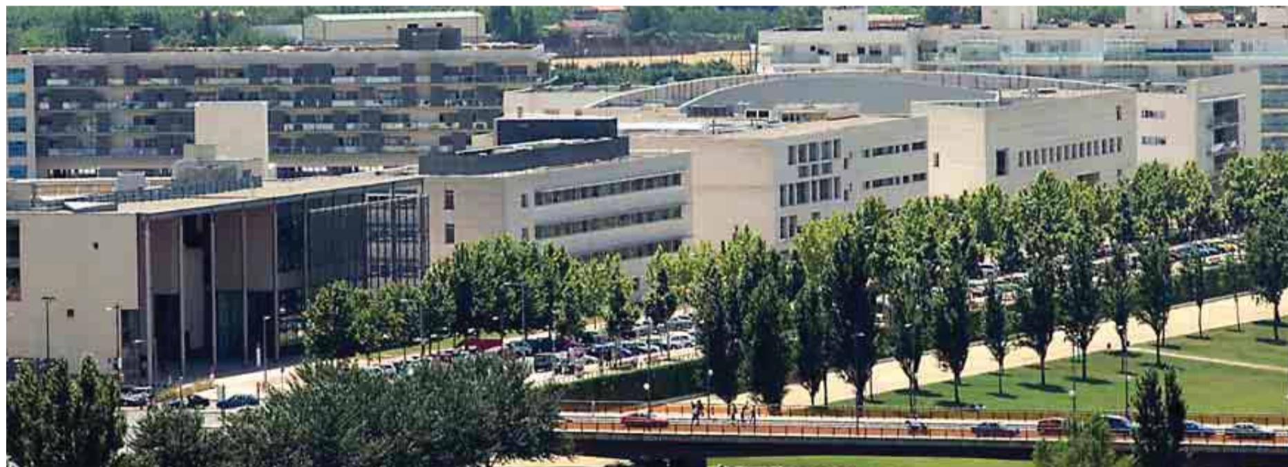
UNIVERSIDAD DE LÉRIDA