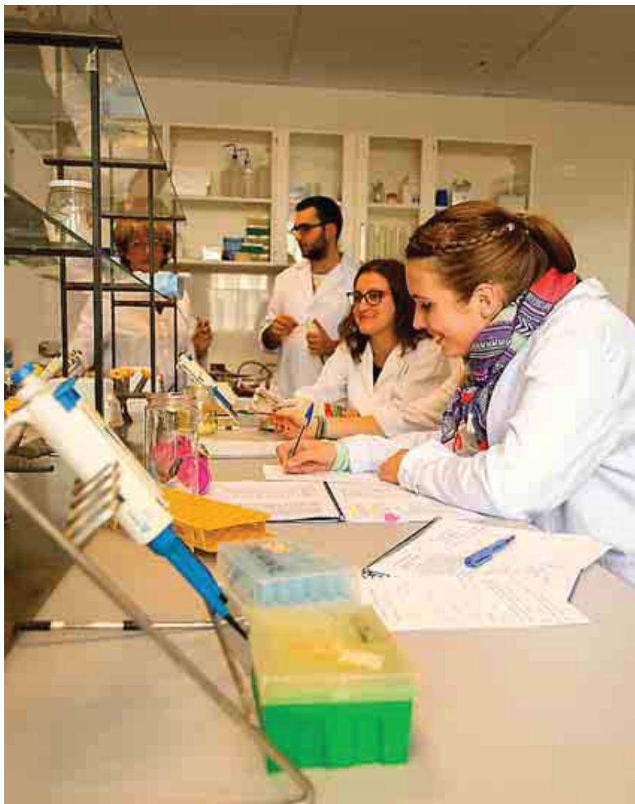
UNIVERSIDAD DE GRANADA

Tiene acuerdos de doble titulación con la Universidad de Varsovia (Polonia), la del Algarve (Portugal) y la del Egeu (Turquía), entre otras.