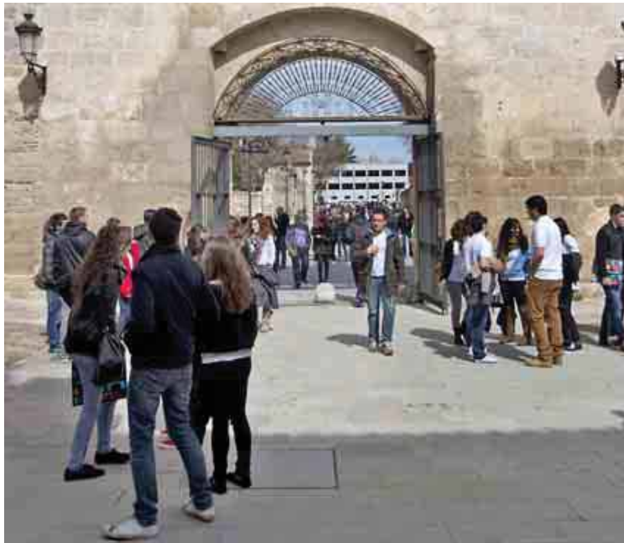
UNIVERSIDAD DE BURGOS