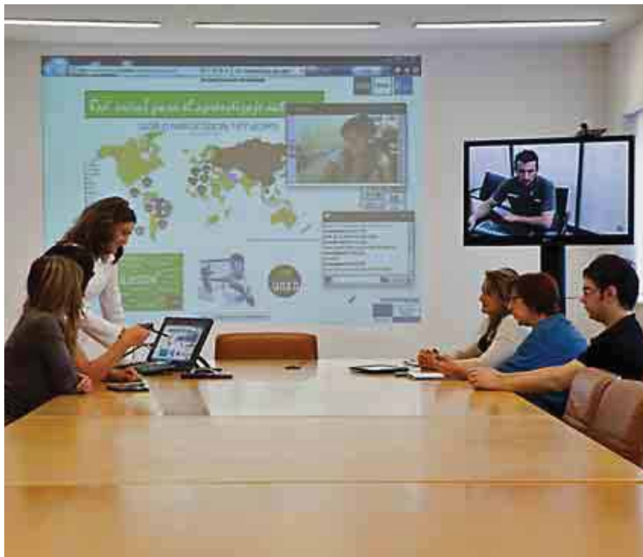
UNIVERSIDAD NACIONAL DE EDUCACIÓN A DISTANCIA

Para el próximo curso 2014-2015, ha incorporado a su catálogo de titulaciones los grados universitarios en Biotecnología e Ingeniería de los Materiales, como «respuesta a las necesidades educativas» de la comunidad y al propio desarrollo de las enseñanzas superiores en la Universidad de Extremadura.