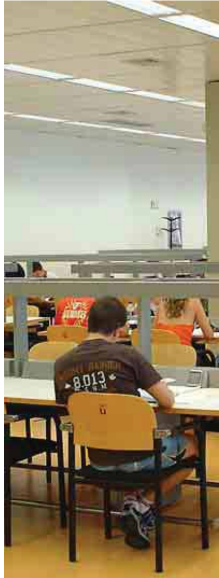
UNIVERSIDAD REY JUAN CARLOS

Dispone de un claustro de buen perfil académico e investigador. Edita la revista Portularia de gran calado en el sector. Incluye 130 plazas