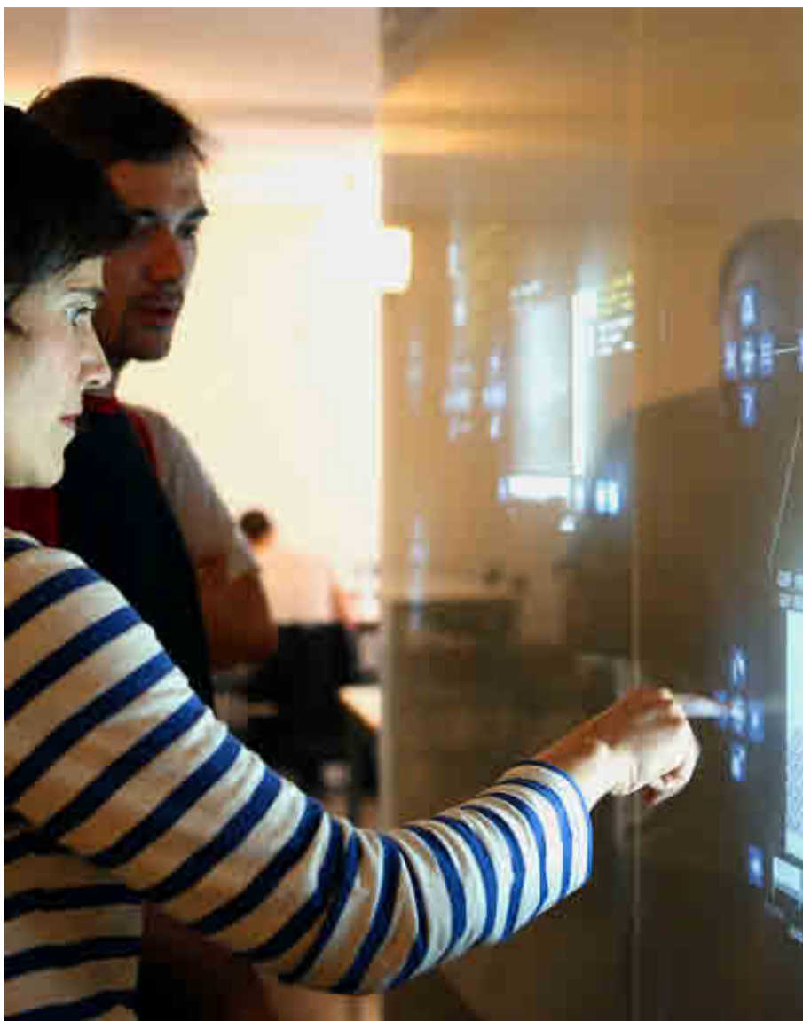
UNIVERSIDAD POLITÉCNICA DE MADRID

Los alumnos pueden elegir entre tres especialidades: Computación, Ingeniería de Computadores y Sistemas de Información.