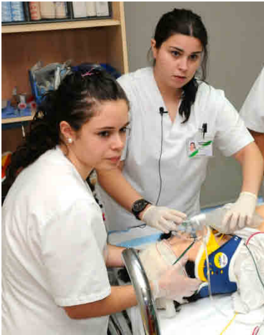
UNIVERSIDAD DE CANTABRIA