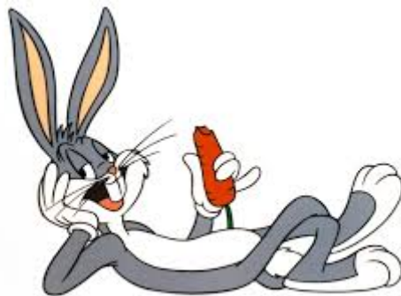
Figura 1.1: Un conill

Quisque ullamcorper placerat ipsum. Cras nibh. Morbi vel justo vitae lacus tincidunt ultrices. Lorem ipsum dolor sit amet, consectetur adipiscing elit. In hac habitasse platea dictumst. Integer tempus convallis augue. Etiam facilisis. Nunc elementum fermentum wisi. Aenean placerat. Ut imperdiet, enim sed gravida sollicitudin, felis odio placerat quam, ac pulvinar elit purus eget enim. Nunc vitae tortor. Proin tempus nibh sit amet nisl. Vivamus quis tortor vitae risus porta vehicula.